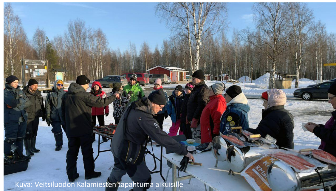
Kuva: Veitsiluodon Kalamiesten tapahtuma aikuisille

3) Osa tapahtumistamme avoimia kaikille, mutta jäsenille edullisempia/maksuttomia, osa tapahtumista vain jäsenille