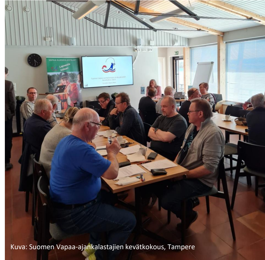
Kuva: Suomen Vapaa-ajankalastajien kevätkokous, Tampere