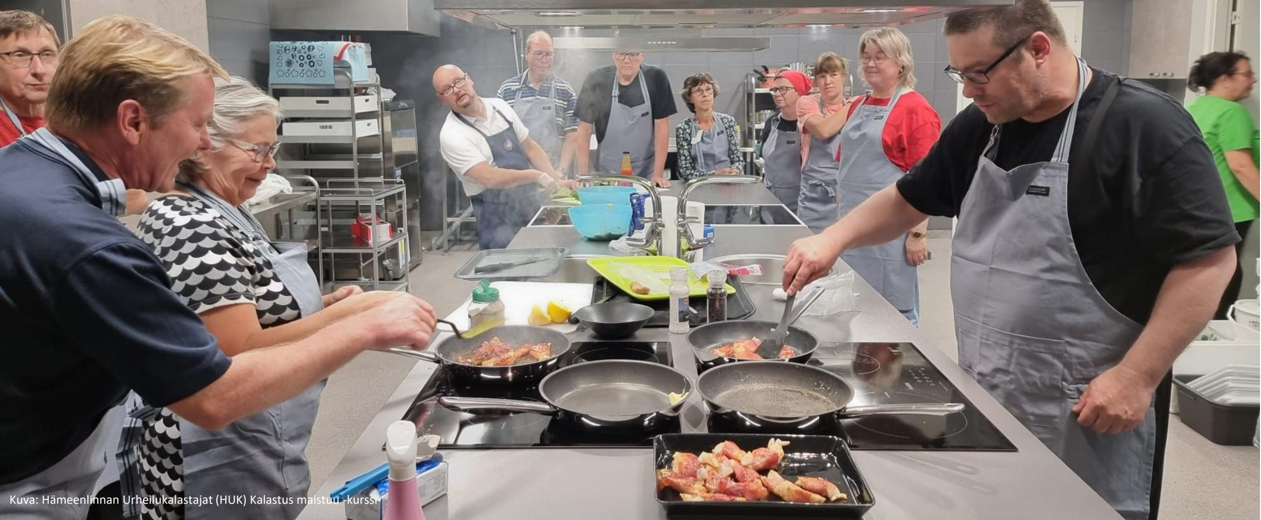
Kalastus maistuu -kurssi